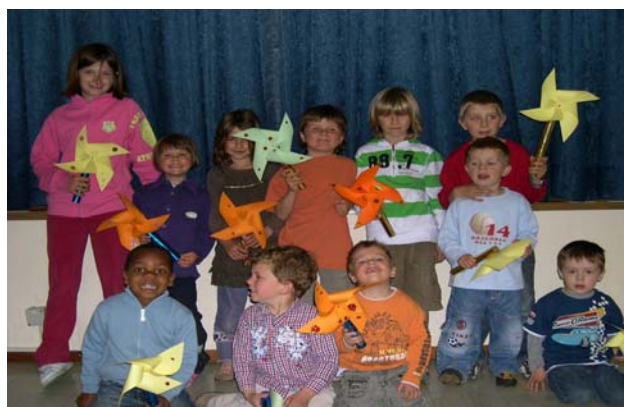
Eveil à la foi du 2 mai 2009

Prochaines rencontres : samedis 5 septembre et 21 novembre de 17h00 à 18h00